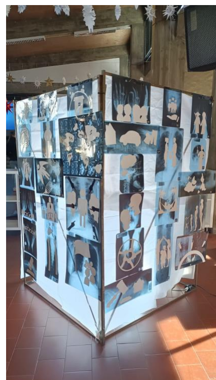
Exposição sobre DH_Alunos Artes