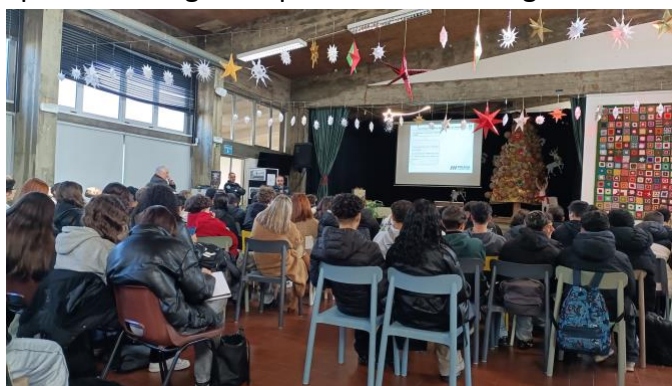
“Os jovens na defesa dos DH” – PSP_Escola Segura

Aqui ficam imagens representativas de algumas atividades desenvolvidas.