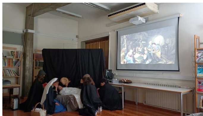
Quadros Vivos_Performance Teatral sobre os DH_10ºB