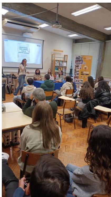
Voluntariado como caminho para os DH