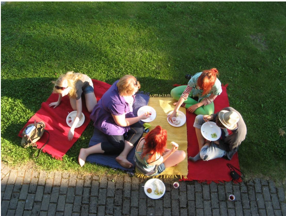
Refeição (multicolorida!) na casa de uma das alunas da escola que nos recebeu.