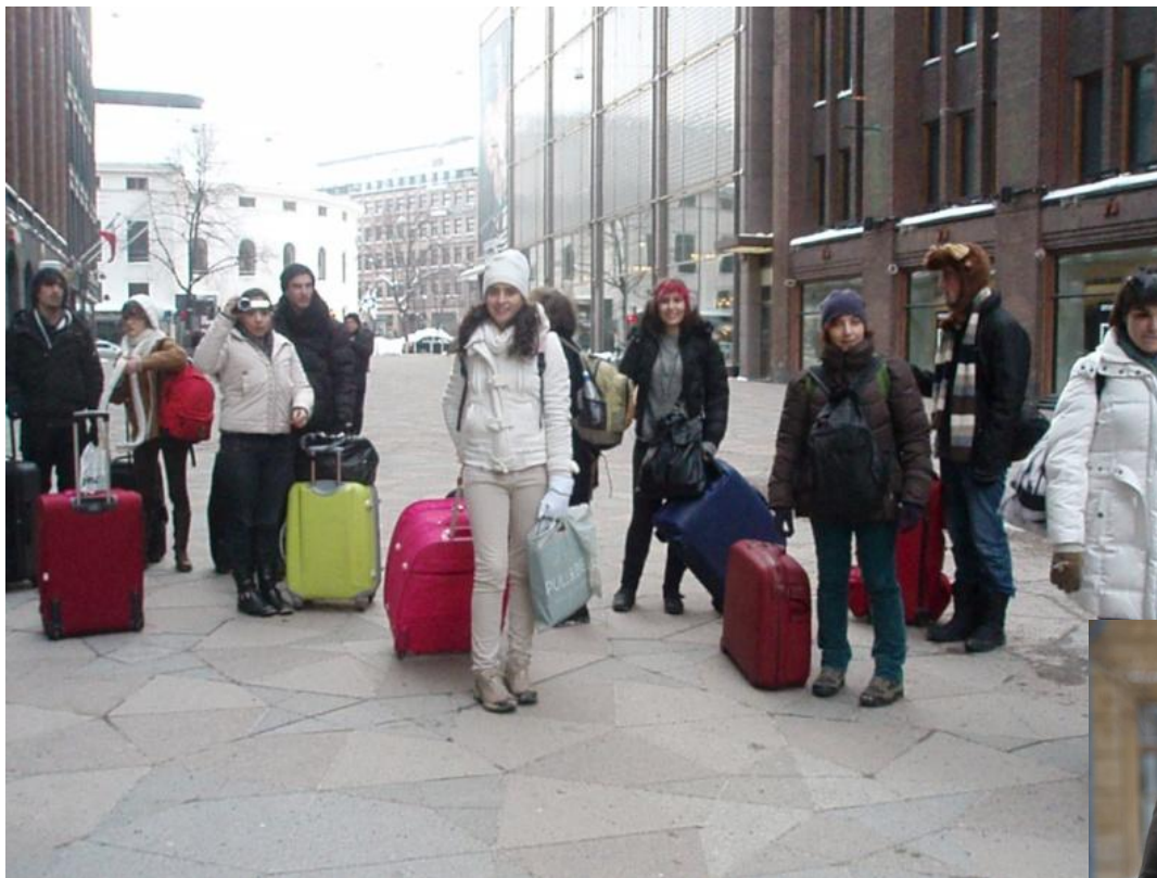
Grupo de Viseu na despedida a Helsínquia.