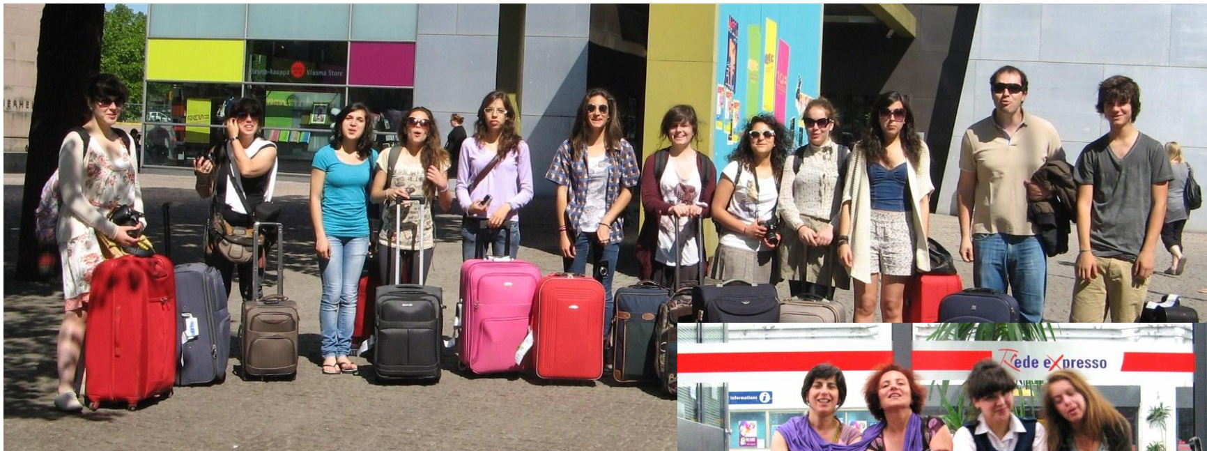
Participantes da Viriato e da Alves Martins na chegada a Helsínquia e no regresso a Lisboa.